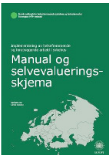
Standarder for helse-frem-mende arbeid i sykehus