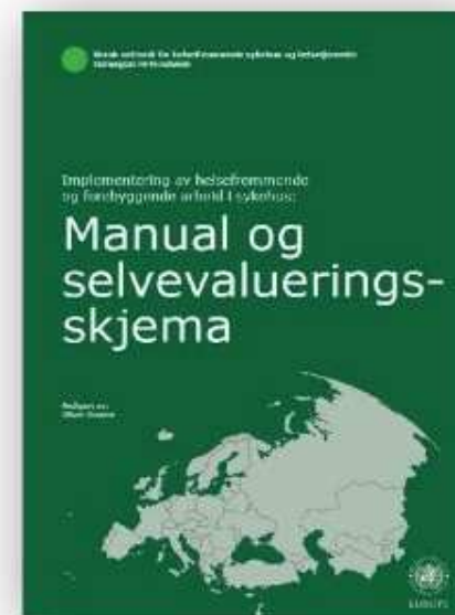
Standarder for helsefremmende arbeid i sykehus